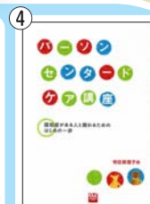
パーソンセンタードケア講座 - 認知症がある人と関わるた めのはじめの歩 - 価格：1,000 円(税込)

※本のご購入だけでも下記の申込用紙からできます。5,000 円以上で送料無料。 ※該当 No. の欄に冊数をご記入の上、お申し込みください。