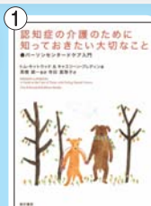
認知症の介護のために知 っておきたい大切なこと - パー ソンセンタードケア入門 - 価格：1,575 円(税込)

はい、あります。入門書としては 「認知症の介護のために 知っておきたい大切なこと～ パーソンセンタードケア 入門」がわかり やすいでしょう。