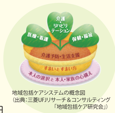
地域包括ケアシステムの概念図

● 受講料／事前振込:7,500円（CLC会員:6,500円）／ 当日支払:8,500円